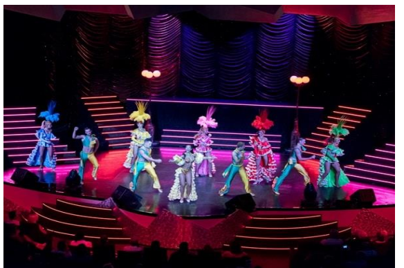
QQCRTKO-MS016 TOKYO-JEJU-KAGOSHIMA 6D5N (CRUISE ONLY) MSC BELLISSIMA