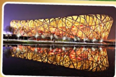
สนามกีฬารังนก