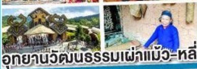
อุทยานวัฒนธรรมเผ่าแม้ว-หลี