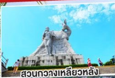
สวนทิวทัศน์สวยหลัง