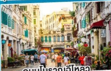
ถนนโบราณอีโหลว