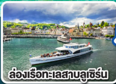
ล่องเรือทะเลสาบลูเซิร์น

เที่ยวครบเส้นทาง Jewels of Romantic Europe ของบาวาเรียและทีโรล