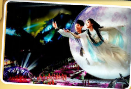
โชว์จิ้งจอกขาว