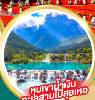
ชมเขาน้ำเงิน ทะเลสาบไป๋สือเหอ