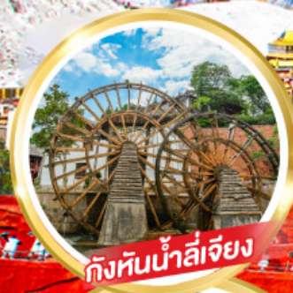
กังหันน้ำลี่เจียง