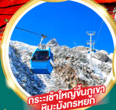
กระเช้าใหญ่ขึ้นภูเขา หิมะมิงกรหยก