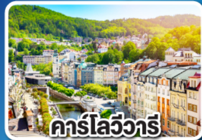
คาร์โลวารี