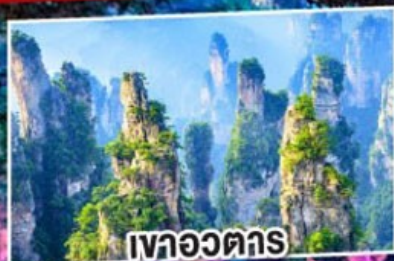
เวาอวตาร