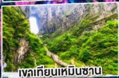
เทียนครบเหมินซาน