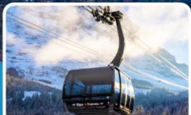
กระเช้า ไอเกอร์เอ็กสเพรส สู่จุงเฟรา

อิตาลี สวิตเซอร์แลนด์ ฝรั่งเศส 10 วัน 7 คืน