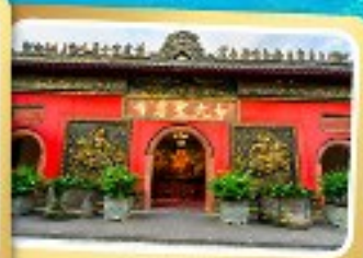
วัดต้าอ้อ