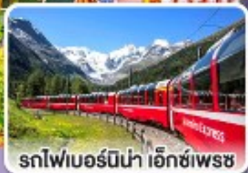
รถไฟเบอร์นีนา เอ็กซ์เพรส

รถไฟสายโรแมนติกและยอดเขาสุดเพี้ยสตร์ อิตาลี สวิตเซอร์แลนด์ ออสเตรีย สโลวาเกีย 10 วัน 7 คืน