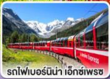
รถไฟเบอร์นีนา เอ็กซ์เพรส