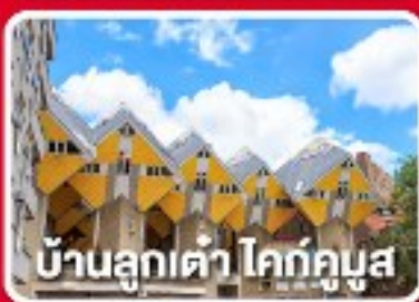
บ้านลูกเต๋า โคกทูมูส

เยือนเมืองแปลกดินแดน 2 ประเทศ บาร์-นัสซา บาร์-เฮิร์ตโท