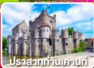
ปราสาทท่านเคานท์