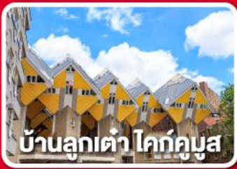
บ้านลูกเต่า ไคท์คูบัส