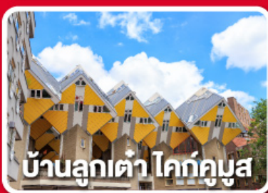
บ้านลูกเต๋า โคทักูบัส