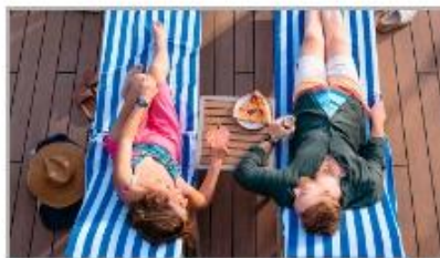
Whatever You Need, Delivered