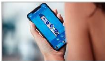
Find Your Way & Your Friends