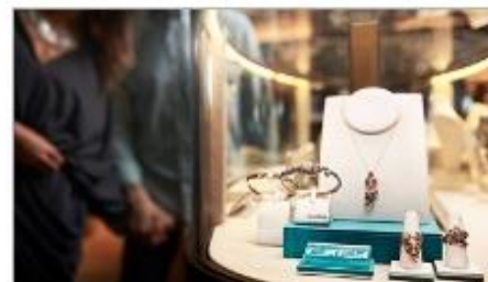
The Shops of Princess