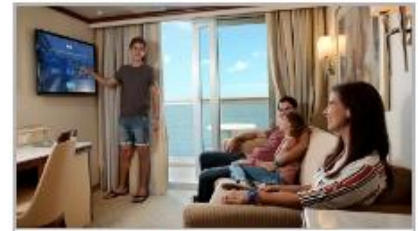
Simplified Safety Training