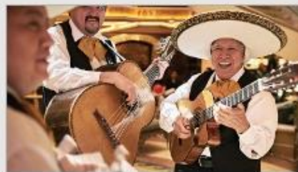
Music & Dancing