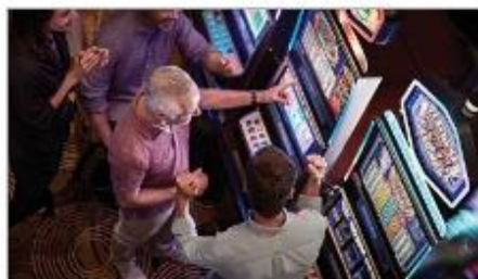
Vegas Style Casino