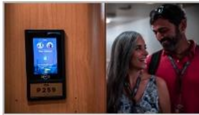
Keyless Stateroom Entry