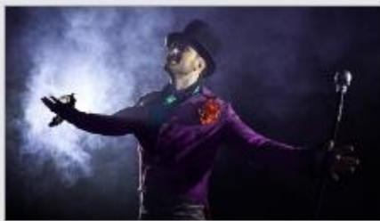
Featured Guest Entertainers