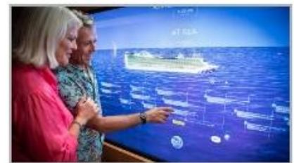
Events On Board