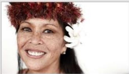
Festivals of the World