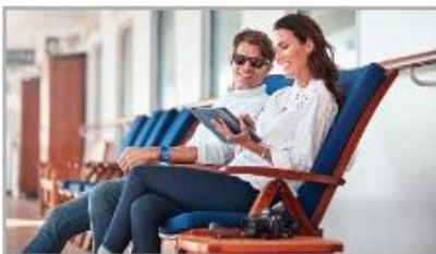
The Best Wi-Fi at Sea