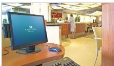
Internet Café & Library

วันที่สี่ของการเดินทาง วันที่ 17 มิ.ย. 67 (MON)