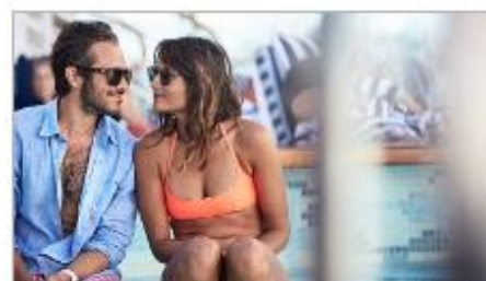
Freshwater Pools & Hot Tubs