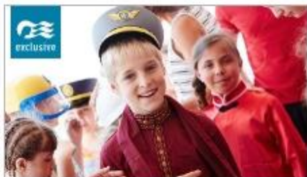
Discovery at SEA Programs

On every Princess ship, you'll find so many ways to play, day or night. Explore The Shops of Princess, celebrate cultures at our Festivals of the World or learn a new talent — our onboard activities will keep you engaged every moment of your cruise vacation. 1