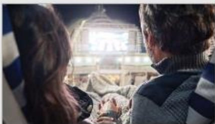
Movies Under the Stars ®

Original musicals, dazzling magic shows, feature films, top comedians and nightclubs that get your feet movin' and groovin'. There's something happening around every corner; luckily, you have a whole cruise of days and nights to experience it all. 1