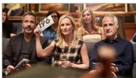
Art Gallery & Auctions