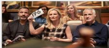
Art Gallery & Auctions