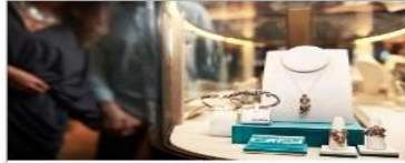
The Shops of Princess