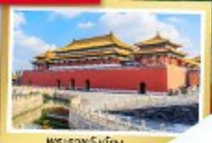
พระราชวังเทียน