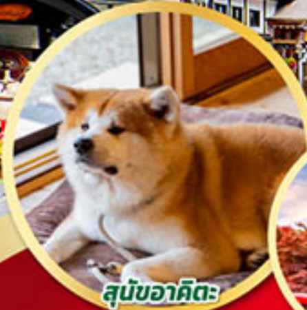
สุนัขอาคิตะ