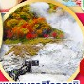
หุบเขานรกจิกุกุคาบิ