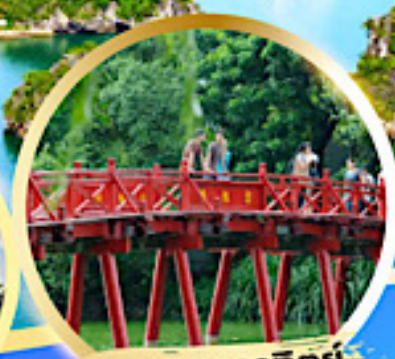
สะพานแสงอาทิตย์