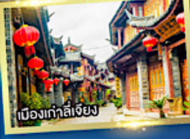
เมืองเก่าลี่เจียง