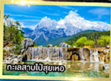
ทะเลสาบไป๋สือเหอ