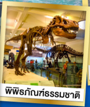
พิพิธภัณฑ์ธรรมชาติ