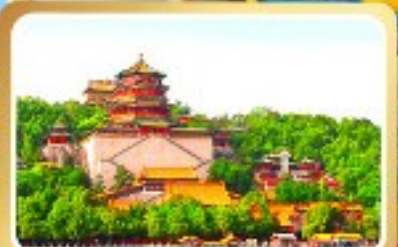
พระราชวังฤดูร้อนอีเหอหยวน