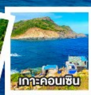
เกาะคอนเซิน