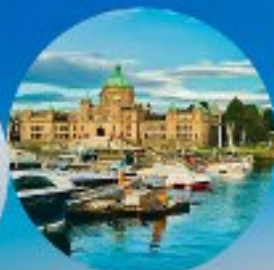
Victoria, British Columbia (Canada)