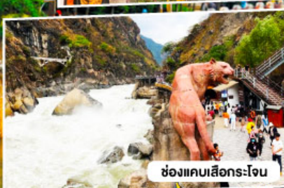
ช่องแคบเสือกระโจน