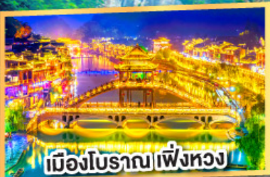
เมืองโบราณเพิ่งหวง