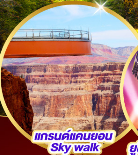
แกรนด์แคนยอน Sky walk