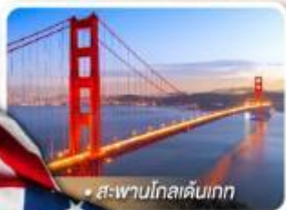
• สะพานโกลเดนเกต

★ เยือนอุทยานแกรนด์แคนยอน ฝั่ง South rim ความมหัศจรรย์ทางธรรมชาติ ที่ยิ่งใหญ่ที่สุดแห่งหนึ่งของโลก