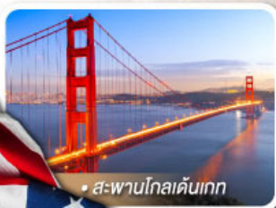
• สะพานโกลเดนเกต

★ เยือนอุทยานแกรนด์แคนยอน ฝั่ง South rim ความมหัศจรรย์ทางธรรมชาติ ที่ยิ่งใหญ่ที่สุดแห่งหนึ่งของโลก