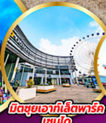
มิตซูเอากะไลท์พาร์ค เซนได