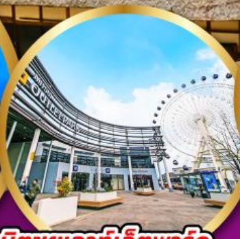
มิตซูเอากะไลท์พาร์ค เซนได