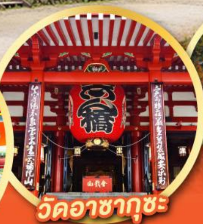
วัดอาซากุซะ