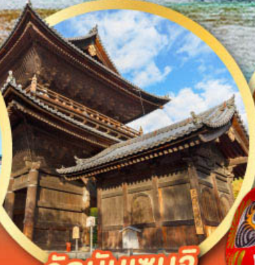
วัดนินเซนจิ