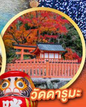
วัดคารุมะ