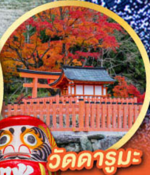
วัดดารุมะ