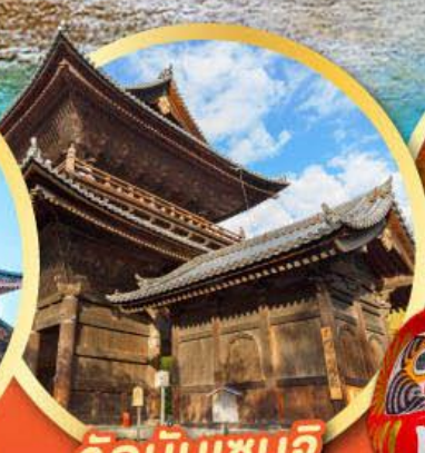
วัดนินเซนจิ