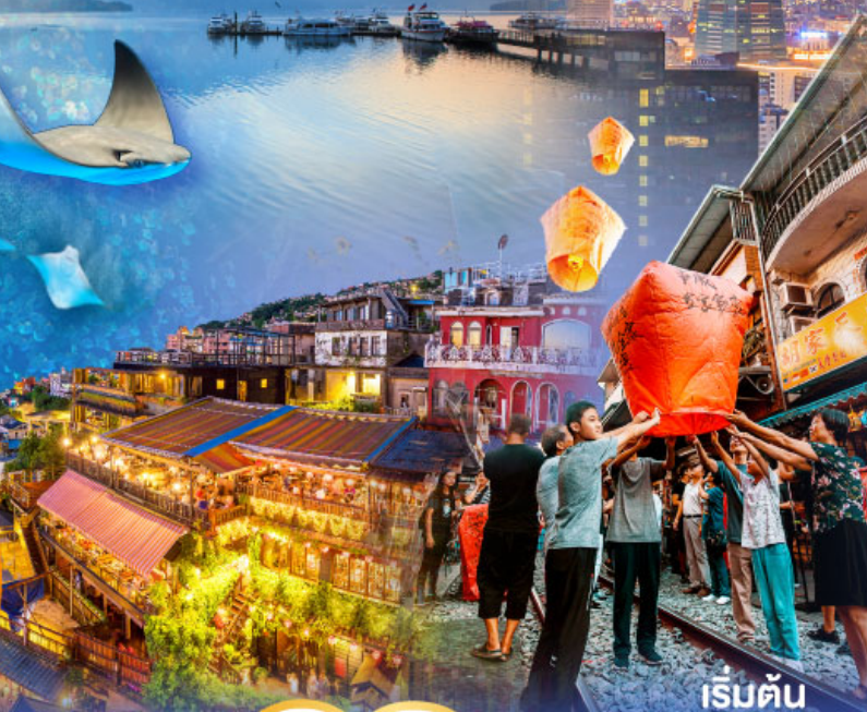
เริ่มต้น