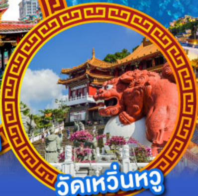
วัดเหวียนหู่