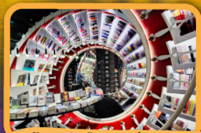
• ร้านหนังสือจิงซูเก้อ