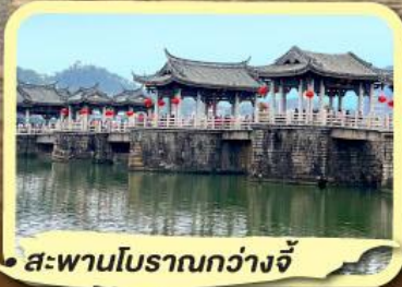
• สะพานโบราณกว่างจี