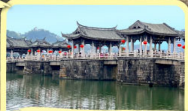
• สะพานโบราณกว้างจี