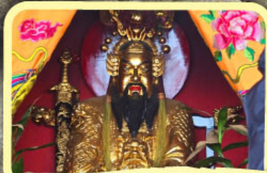
• เอียงบูซิว (ศาลเจ้าพ่อเอี้ยง)