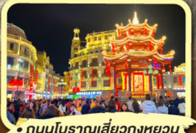
• ถนนโบราณเสี่ยวกงหยวน