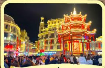
• ถนนโบราณเสี่ยวกงหยวน