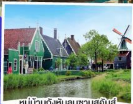
หมู่บ้านกังหันลมซานสคินส์