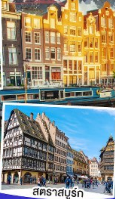
สตราสบูร์ก