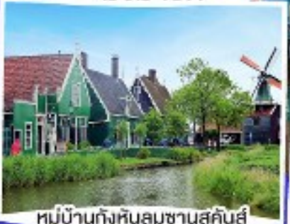
หมู่บ้านกังหันลมซานสคีนส์