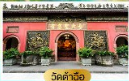
วัดต้าอ้อ