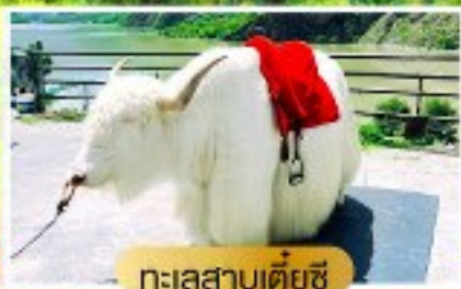
ทะเลสาบเต๋ยซี