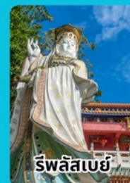
ริพลีสเบย์