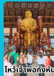
ไหว้เจ้าพ่อก้งหัน