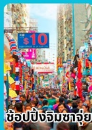
ช้อปปิ้งจิมซาฉุย