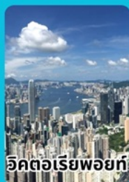
อิคตอเรียพอยท์