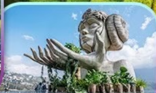
Moana Sapa Cafe