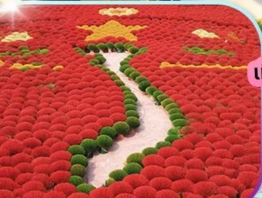
หมู่บ้านรูป