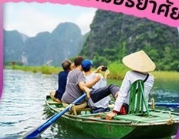
นั่งเรือกระจาด