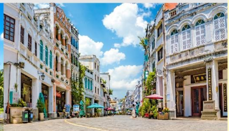
ถนนโบราณฉีไหลว

*ทางบริษัทฯ ขอสงวนสิทธิ์ในการสลับโปรแกรมทัวร์ตามความเหมาะสมขึ้นอยู่กับสถานการณ์หน้างาน โดยคำนึงถึงผลประโยชน์ของลูกค้าเป็นสำคัญ