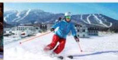
ลานสกียาปูสี

*ทางบริษัทฯ ขอสงวนสิทธิ์ในการสลับโปรแกรมทัวร์ตามความเหมาะสมขึ้นอยู่กับสถานการณ์หน้างาน โดยคำนึงถึงผลประโยชน์ของลูกค้าเป็นสำคัญ