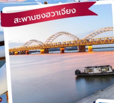
สะพานชงฮวาเจียง