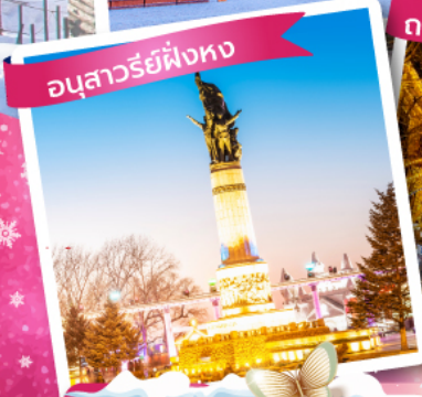
อนุสาวรีย์ฟิ่งทง