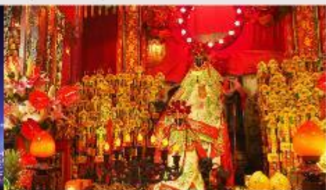
วัดเจ้าแม่กวนอิมของฮ่า

*ทางบริษัทฯ ขอสงวนสิทธิ์ในการลုပ်โปรแกรมทัวร์ตามความเหมาะสมขึ้นอยู่กับสถานการณ์หน้างาน โดยคำนึงถึงผลประโยชน์ของลูกค้าเป็นสำคัญ