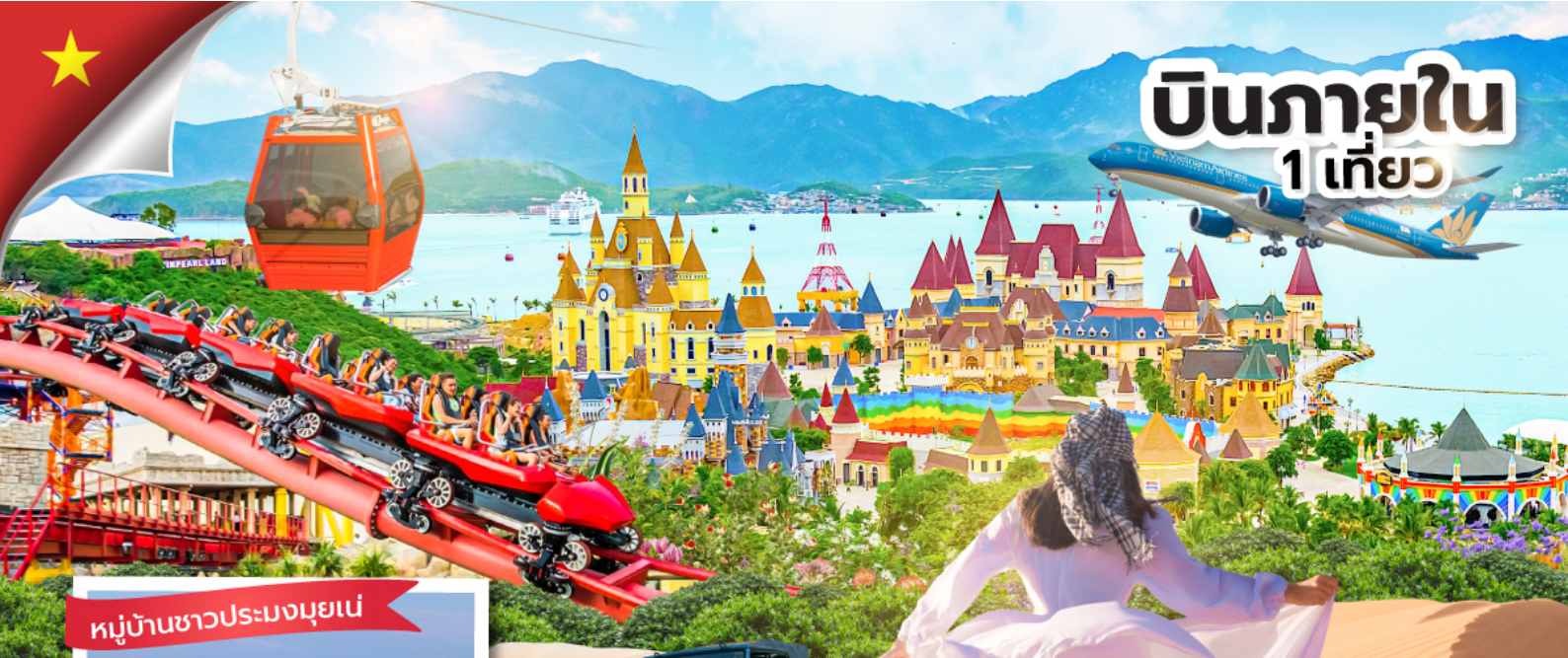
หมู่บ้านชาวประมงมุยเน่