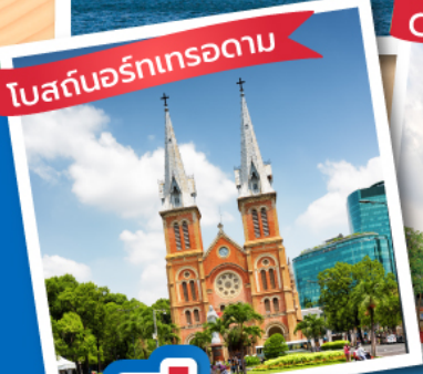
โบสถ์นอร์ทเทรอดาม