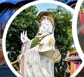
เจ้าแม่กวนอิม รัชัลส์ เบย์