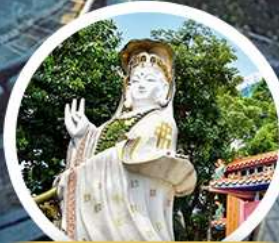
เจ้าแม่กวนอิม รัฟลีส เบย์