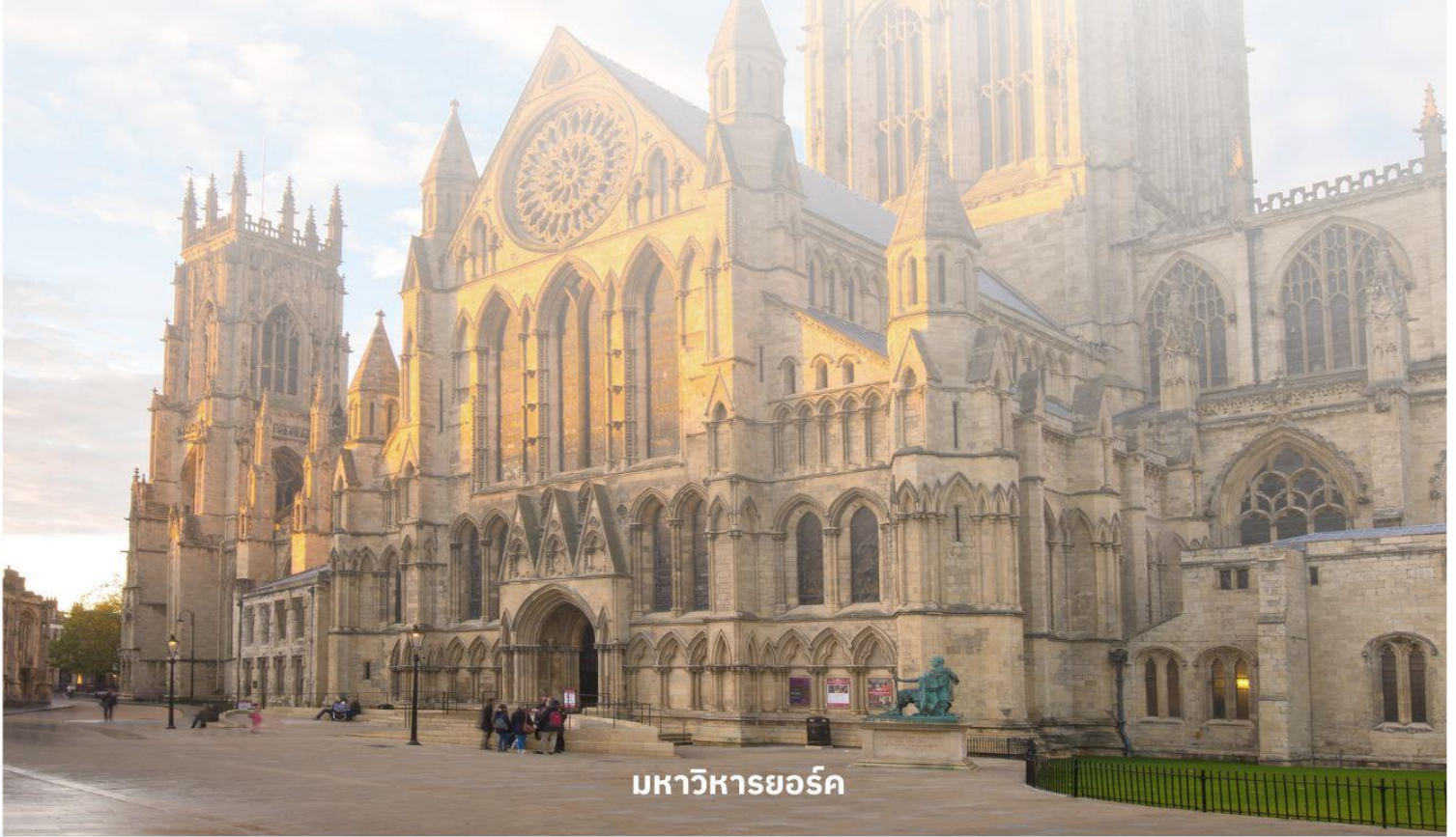
มหาวิหารยอร์ก

จากนั้นนำท่านเดินทางต่อไปที่ The Shambles (เดอะแซมเบิล) เป็นสถานที่ที่มีความคล้ายกับตรอกไดอากอนในภาพยนตร์ชื่อดังอย่าง Harry Potter อีสาระให้ท่านเดินเลือกซื้อของที่ระลึกตามอัธยาศัย