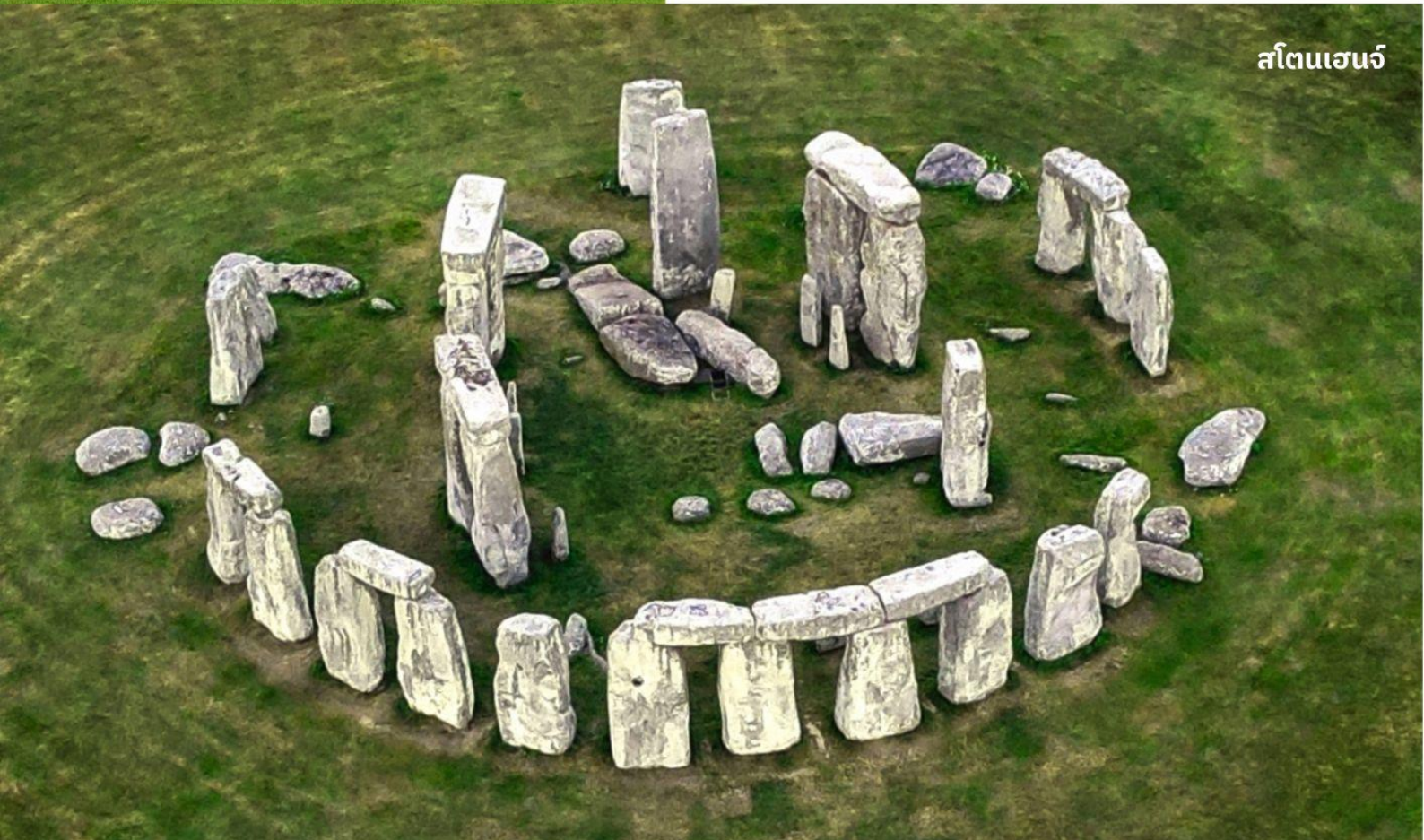
สโตนเฮนจ์

จากนั้นนำท่านเดินทางสู่ ซาลส์เบอรี ใช้เวลาเดินทางประมาณ 1 ชั่วโมง เป็นทุ่งหญ้าอันกว้างใหญ่ที่เป็นที่ตั้งของหนึ่งในเจ็ดสิ่งมหัศจรรย์ของโลกยุคกลาง จากนั้นนำท่านเข้าชมสโตนเฮนจ์ วงหินปริศนาแห่งเกาะอังกฤษนับเป็น สร้างขึ้นราว 3,000 ปีก่อนหน้านี้ ไม่เป็นที่ทราบแน่ชัดว่าทำไมสิ่งนี้จึงถูกสร้างขึ้นมา แต่จากลักษณะของการก่อสร้างทำให้ทราบว่าผู้ก่อสร้างต้องมีฐานอำนาจอยู่ไม่น้อย เนื่องจากหินที่ตั้งอยู่ 112 ก้อนนั้นไม่ใช่หินที่มีลักษณะทางกายภาพที่ใกล้เคียงกับหินที่อยู่ในบริเวณนี้ ถือว่าเป็นหนึ่งสถานที่ที่ยังคงมีปริศนาเกี่ยวกับว่าใครเป็นผู้สร้าง สร้างได้อย่างไร และสร้างมาเพื่ออะไร ?