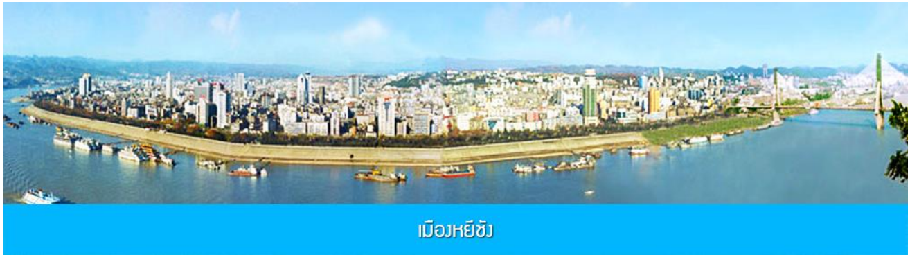
เมืองหยีฉาง

- เที่ยวเต็มสุข ไม่ต้องเร่งรีบเข้าร้านช้อปปิ้งบังคับ - บินกลางวัน ไม่อดนอนเหมือนเที่ยวบินกลางคืน - โปร่งใสน่าเชื่อถือ ไม่มีค่าใช้จ่ายซ่อนเร้น - ไม่เก็บทิปก่อนเที่ยว เพราะมั่นใจในคุณภาพ