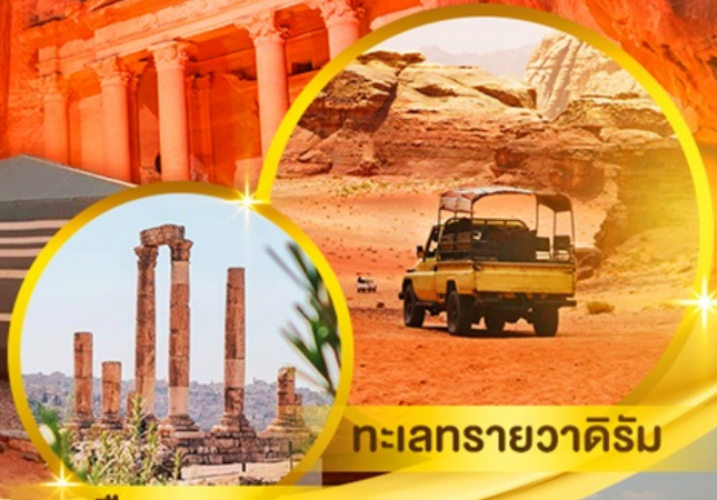
เมืองจอร์แดน