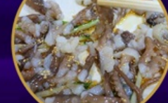
ซันนั๊กจิ อาหารท้องถิ่น